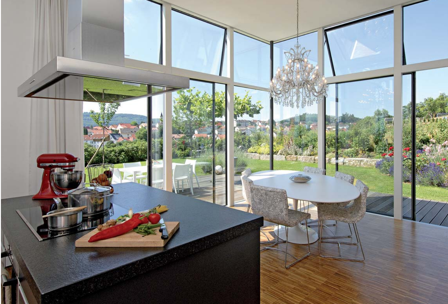
Die Fenster, mit filigranen Rahmen, außen Aluminium, innen Holz, stammen von einem dänischen Hersteller.