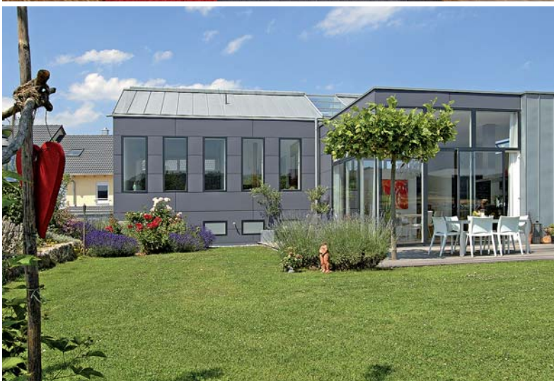
Titanzink und graue Faserzementplatten prägen die Fassade. Nach Problemen mit der ersten Lieferung der Platten sorgte der Hersteller für 100-prozentigen Ersatz.