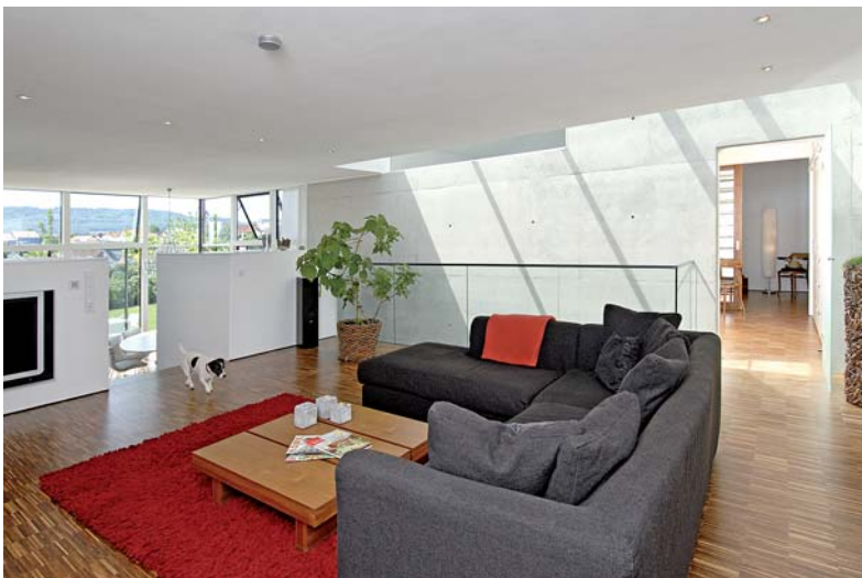
Sichtbeton, Holz und weiße Wände zählten zu den Vorgaben.